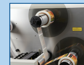
Rewinding to multiple finished rolls