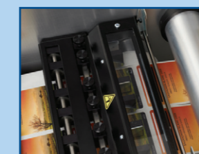
7 blade slitter station